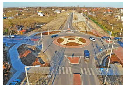
■ Kecskemét , új gyűjtőúti körútja, Károly Róbert krt. I. üteme és a „Kecskeméti Arborétumi Körforgalmú Csomópont ” tervezése (2017)