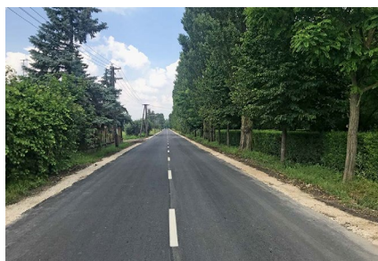
■ Kiskunhalas , Tinódi utca, rekonstrukció tervezése (2018)