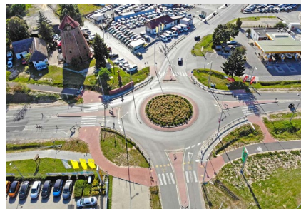
■ Kecskemét, Déli Iparterület megközelíthetőségének javítása az 5. számú főútról, „Szélmalom Csárdai körforgalmú csomópont” tervezése (2015)