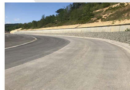
■ Biatorbágy , CTP logisztikai központ infrastruktúra tervezése (2017)