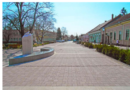
■ Jánoshalma, településközpont rekonstrukció (2009)