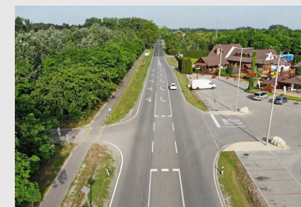
■ Kecskemét , 52. sz. főút településhatármenti fejlesztése, a „Csalánosi Csárdai Csomópont ” tervezése (2016)