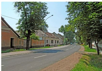
■ Királyhegyes - Makó, 4424. jelű összekötőút felújítása (2009)