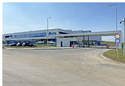
■ Tatabánya , DOOSAN telephely, infrastruktúra-fejlesztés (2018)