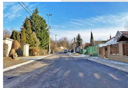
■ Gödöllő , útfelújítások- útfejlesztések (2019-2020)