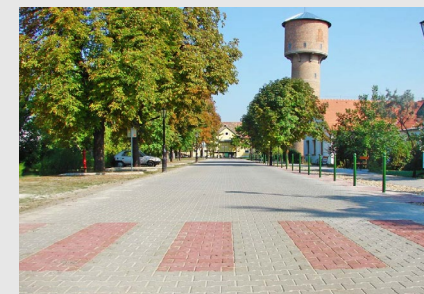
■ Herceghalom, településközpont rekonstrukció (2008)