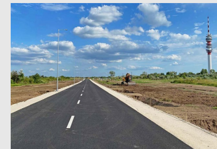
■ Kiskunfélegyháza , Ipari Park II. kialakítása, komplett infrastruktúra-fejlesztés (2018)