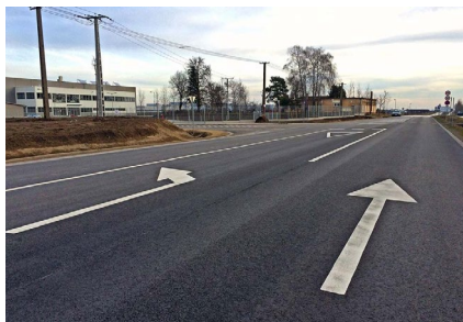
■ Kecskemét, Déli Iparterület, Daimler út, közúti csomópont tervezése (2015)