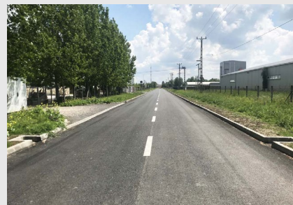
■ Szentés, Ipari park - Bese László utca tervezése (2015)