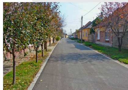
■ Kalocsa, úthálózatfejlesztés (2009)