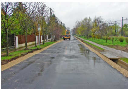
■ Szentendre, Pannónia-telep, úthálózat felújítása (2010)