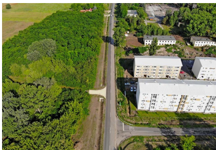
■ Kecskemét - Homokbánya, Déli feltáróút tervezése (2016)