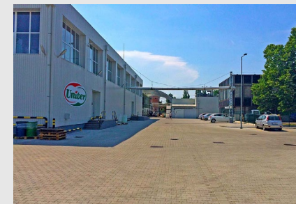
■ Kecskemét, UNIVER- PRODUCT Zrt. telephely, infrastruktúra-fejlesztés (2014)